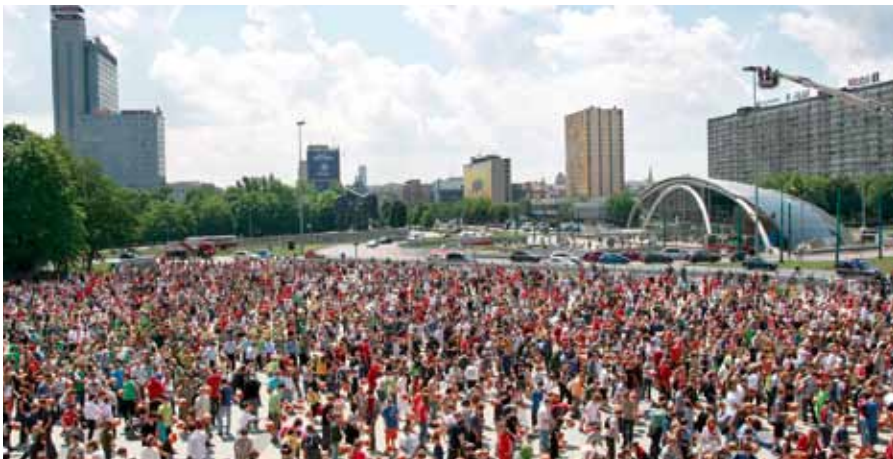
欧洲本域区中首屈一指的众多文化、体育和商业活动，使得卡托维兹的形象更为正面

如今的上西里西亚首府已是真正的欧洲都市，其地方政府在努力发展经济的同时，对文化和教育也不遗余力。