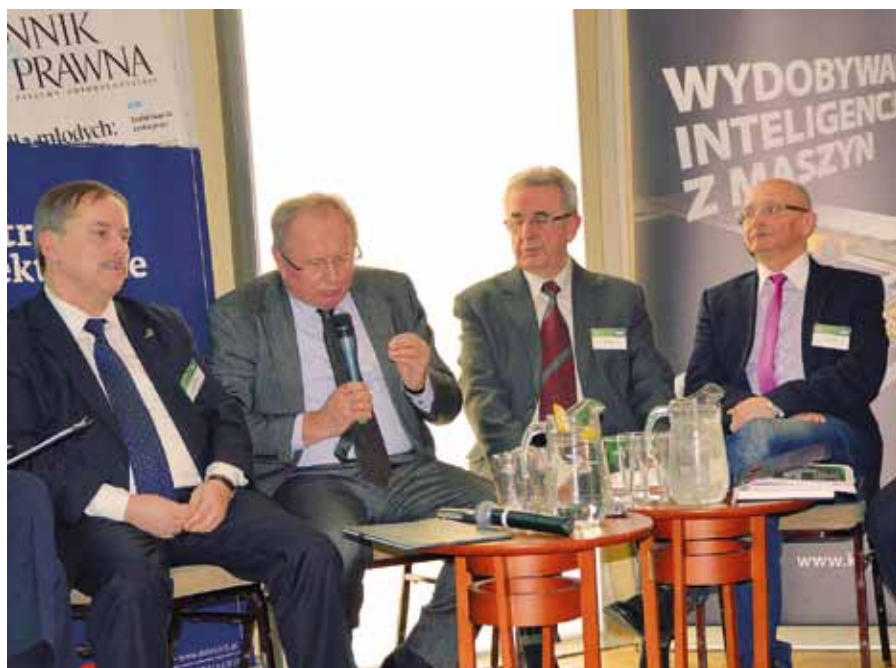
卡托维兹2014年2月15日，矿业大会