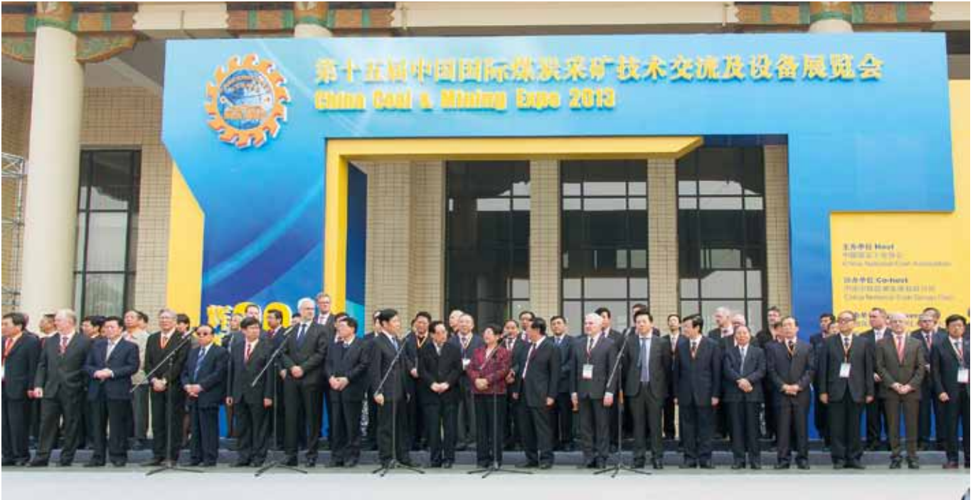
北京博览会开幕典礼

中国煤炭与矿业博览会是全世界规模最大和最重要的采矿业盛会。在2013年，波兰矿用机械及设备企业除了参加展台展览以外，企业代表还参加了中波矿业合作研讨会。在长达几个小时的时间里中国矿业代表听取了波兰企业的成果推介。