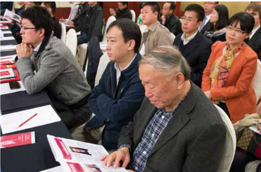
新矿工中文第五期专版激起了科技大会与会人员的极大兴趣