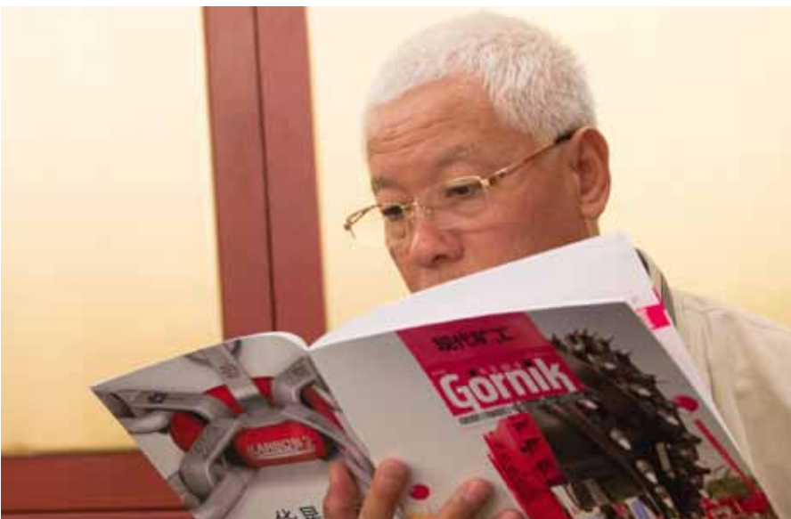
在新矿工中文第五期中我们介绍了波兰企业，探讨了中波合作前景