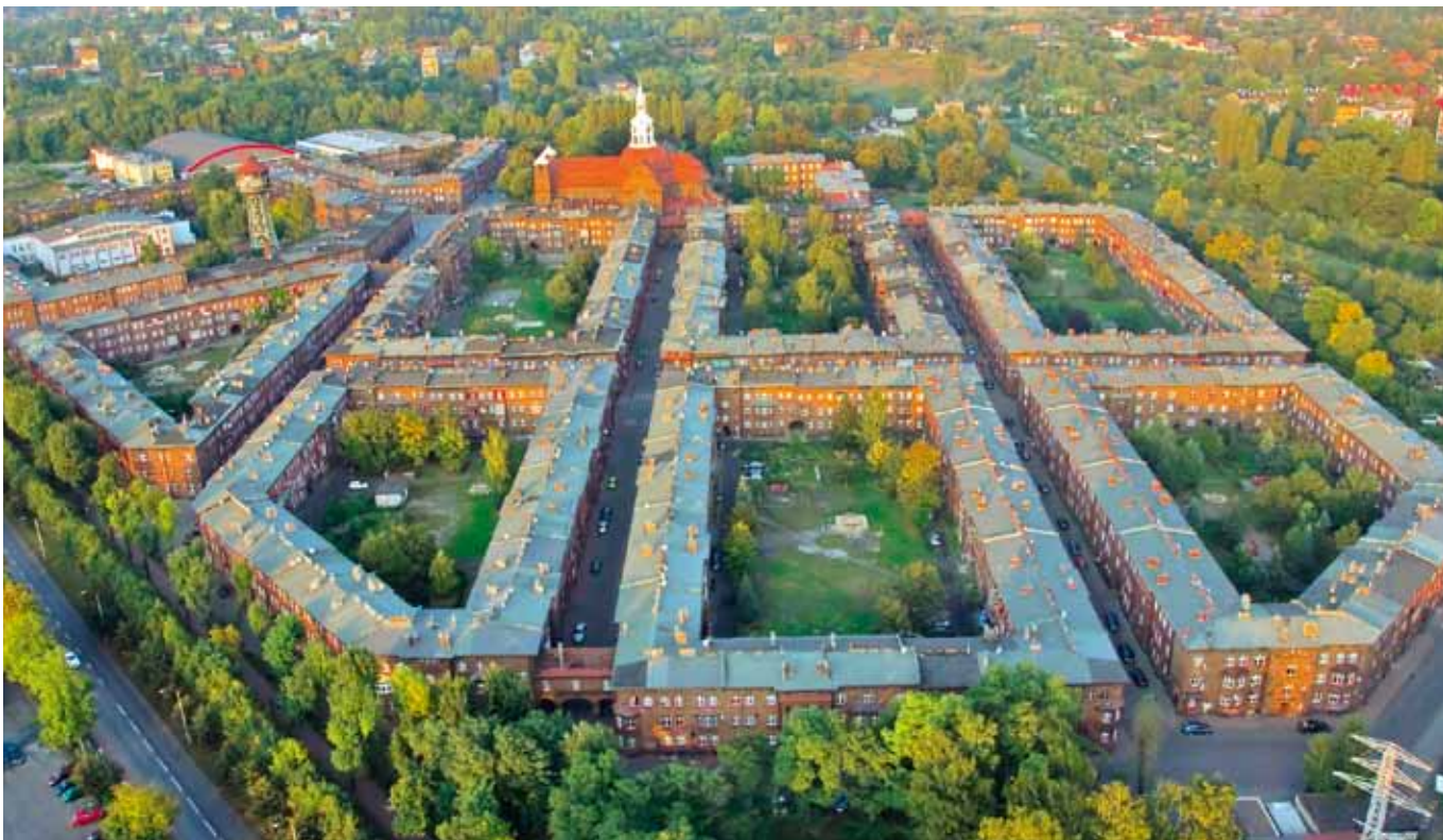
尼基索维茨--始建于1908年的矿山住宅区

搬入新址后的开幕音乐会。毗邻波兰国家广播交响乐团的多功能“特级”建筑--国际会议厅的工程也进展顺利。在这片曾经属于“卡托维兹”煤矿，被划入城市后工业遗产的区域，经西里西亚省议长的努力，建起了部分深入地下的西里西亚博物馆，其大量镶嵌玻璃的采用，吸引了众多目光。