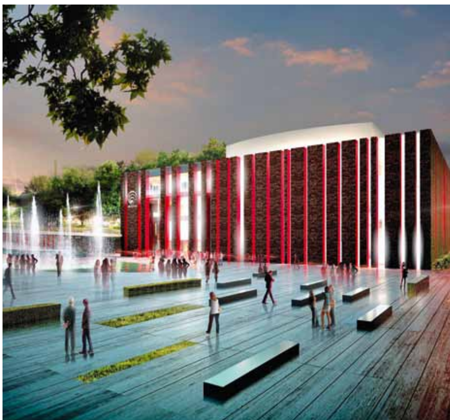
拥有现代化音乐厅的波兰广播交响乐团总部

今日的卡托维兹注重大学教育、文化和高科技，并结合新的交通网络、现代化公用建筑、休闲娱乐区等，使该市具有特殊的吸引力。卡托维兹对当前和未来居民而言日益友善，到访的游客亦不断增加中。