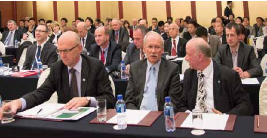
柯派克斯公司正副董事长均出席了中波矿业合作科技大会。柯派克斯公司为中国煤矿献出了一份特殊礼物。它就是黑龙工作面成套系统